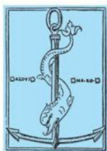
Master in Professione Editoria